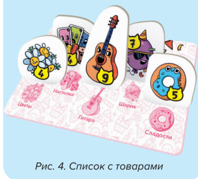
Рис. 4. Список с товарами

Игра заканчивается, когда кто-то из игроков купит все товары из своего списка, — он и объявляется победителем.