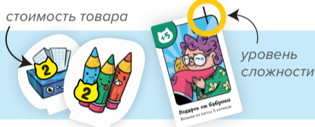
Рис. 1. Товары и карта действия

Выложите в центр стола (на «витрину») 6 случайных товаров лицом вверх — в два ряда по три штуки. Остальные товары положите в коробку лицом вниз. В игре используются карты действия с одной полоской. Перемешайте их и положите на стол лицом вниз. Каждый игрок получает 6 котиков (по одной монете 1, 2 и 3). Оставшиеся монетки разложите по ячейкам кассы.