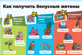
Рис. 6. Табличка-памятка