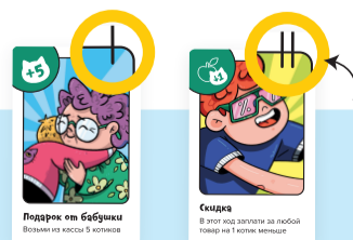
Рис. 3. Карты действия

Кто-то едет на дачу, кто-то идёт в гости, а кто-то отправляется в поход — к каждому событию нужно подготовиться! Чтобы ничего не забыть, идём в магазин со списком покупок.