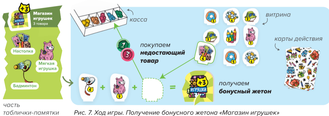
Рис. 7. Ход игры. Получение бонусного жетона «Магазин игрушек»

Купив все товары из одной категории, игрок открывает специализированный магазин и получает бонусный жетон. Списки товаров указаны на табличке-памятке. Один игрок может получить не более трёх бонусных жетонов, при этом жетоны одного игрока могут быть одинаковыми (например, две «Продуктовые лавки»).