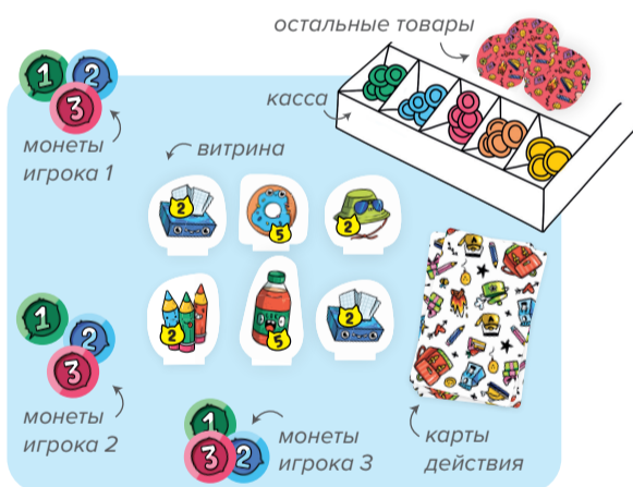
Рис. 2. Раскладка

3. На «витрину» выкладывается новый товар, ход переходит дальше.