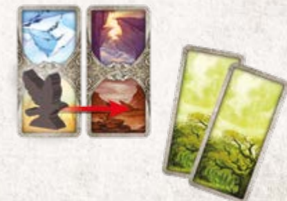
Игрок использует 2 карточки Леса, чтобы переместить своего ворона на одну локацию Гор.

Если у игрока нет карточек полета, которые совпадают с ландшафтом в локациях перед его вороном, он может использовать две любые одинаковые карточки полета так, как будто это нужная ему для перемещения карточка. Игроки складывают свои сыгранные карточки полета на столе лицом вверх в стопку сброса. Если стопка карточек полета закончится, игрок перетасовывает свою стопку сброса и формирует из нее новую стопку карточек полета.