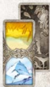
40 карточек земель