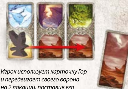
Игрок использует карточку Гор и передвигает своего ворона на 2 локации, поставив его на вторую карточку Гор.

перелет через три, а то и больше, локаций с одинаковым ландшафтом.