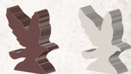
2 деревянных ворона