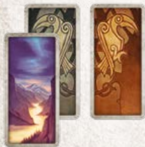
50 карточек полета (по 25 для каждого игрока)