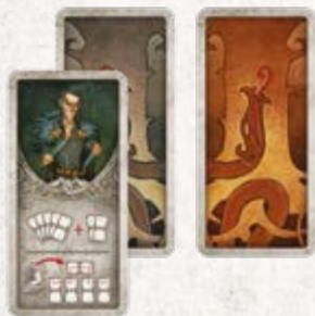
16 карточек Локи (по 8 для каждого игрока)