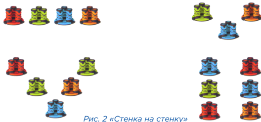
Рис. 2 «Стенка на стенку»

«Стенка на стенку». У Игрока 1 несколько дисков с пушками, которые могут быть выстроены на ровной поверхности в различном порядке (см. Рис. 2 для примеров расстановки).